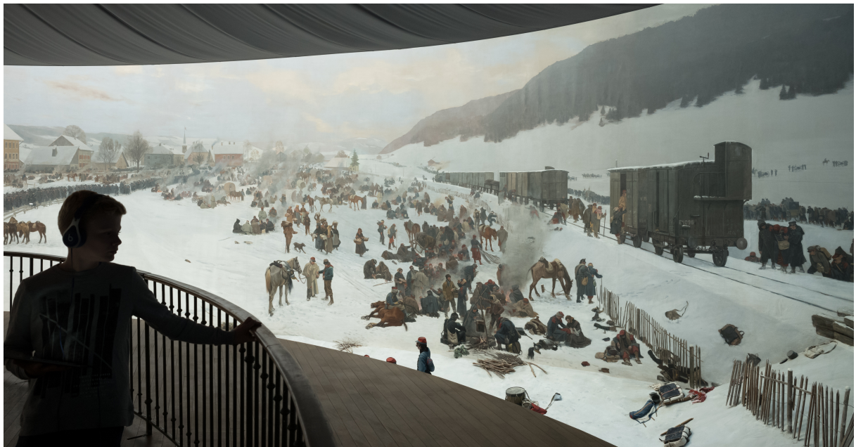
The Bourbaki Panorama (Lucerne), illustrating the internment of the French army under general Bourbaki in 1871 at Les Verrières (NE)